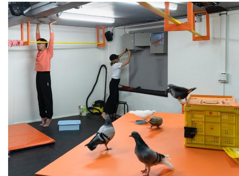
A ROUGH LOVE Theater Basel, 2022, © Jonas Gillmann